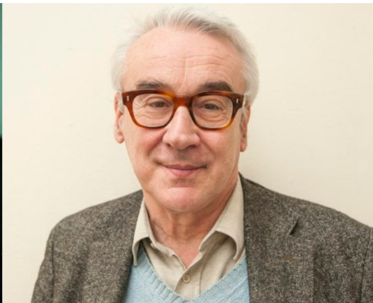
Edgar Morin - Giulio Giorello

Ogni secolo è stato protagonista di numerose rivoluzioni, ma quali sono le conseguenze sul nostro modo di vivere e pensare? Come le idee danno vita ai grandi capovolgimenti del mondo e allo stesso modo come li accolgono? L'appuntamento " Troppi italiani nell'Atelier! Cronache di un "colpaccio" nella Storia dell'arte " vedrà protagonista lunedì 25 giugno la scrittrice Rachele Ferrario sul libro " Les Italiens. Sette artisti alla conquista di Parigi " (UTET), che racconterà dei sette artisti italiani e "metechi", come li chiamano con disprezzo i parigini, nella capitale della Belle Époque del 1911: Giorgio de Chirico, Alberto Savinio, Mario Tozzi, René Paresce, Massimo Campigli, Filippo De Pisis, Gino Severini.