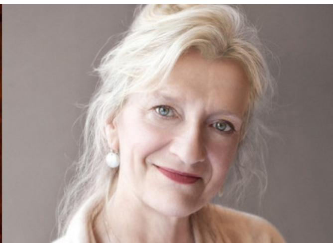
Amos Oz – Elizabeth Strout